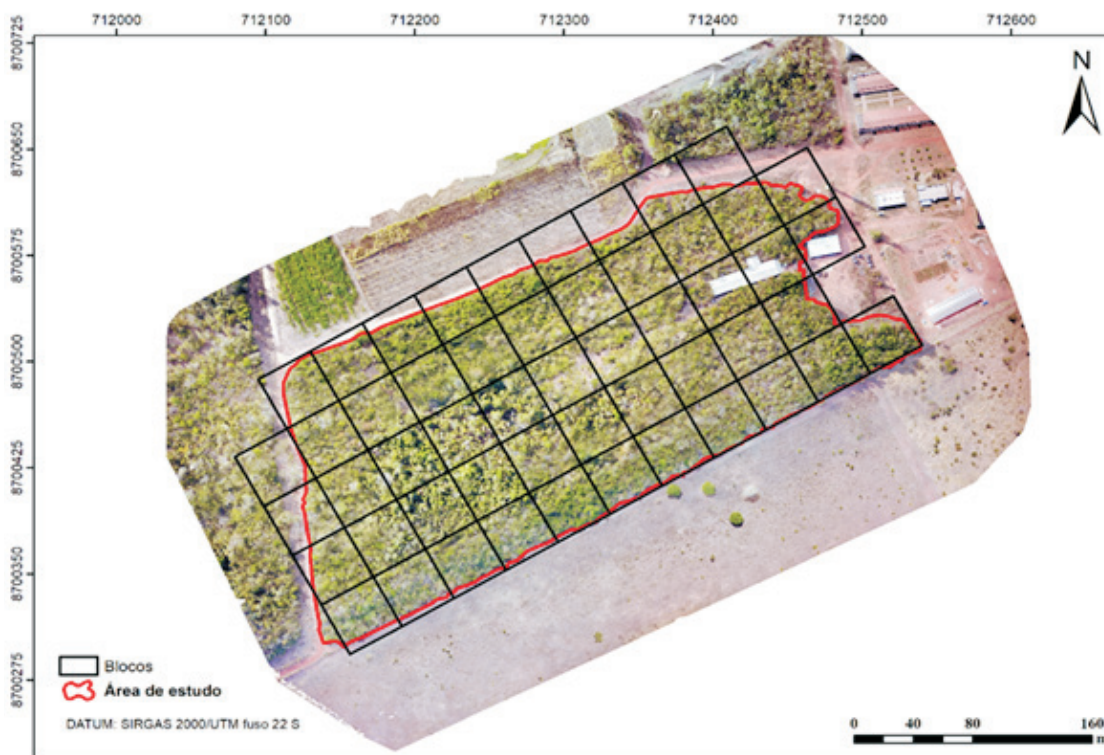
Figura 1. Área Estação Experimental do Centro de Monitoramento Ambiental e Manejo do Fogo, dividida em blocos (40 x 40 m), Gurupi, TO.

Figure 1. Area of the Experimental Station of the Center for Environmental Monitoring and Fire Management, divided in blocks (40 x 40 m), Gurupi, Tocantins State.